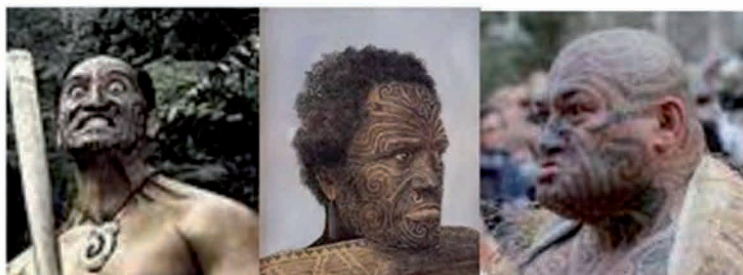
Guerrieri Māori, Nuova Zelanda